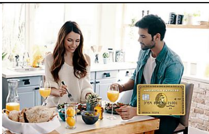
Richiedi Carta Oro American Express e hai il primo anno di quota gratuita. (American Express)