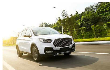
Pescara: i concessionari vendono auto invendute a prezzi sorprendenti (SUV | Annunci di ricerca)