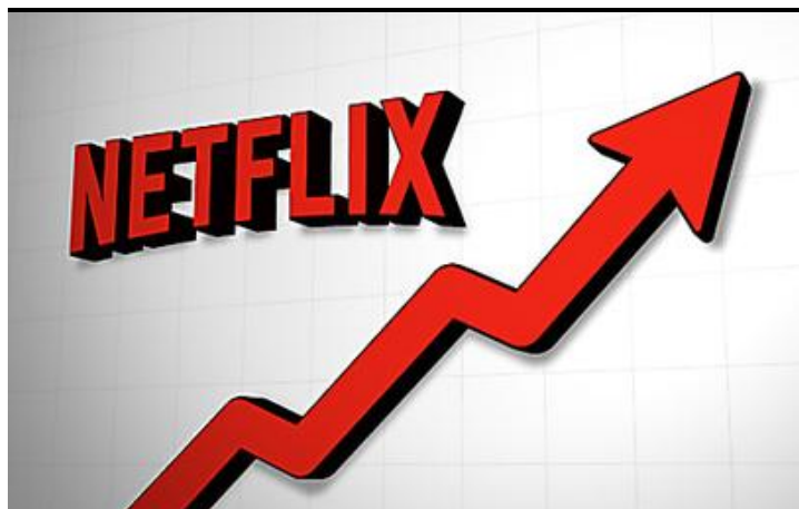
Cosa sarebbe successo se aveste investito $1K in Netflix un anno fa? (eToro)