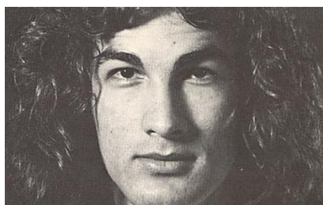
[Fotografie] 28 attori che erano atleti incredibili (Habittribe)