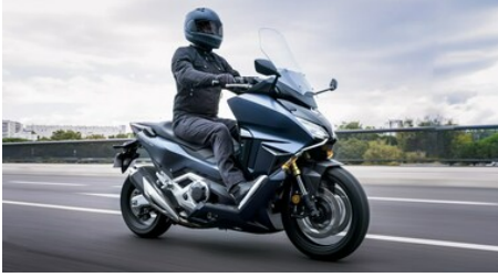
Ingegno Honda, la Forza di un'idea: l'affermato scooter diventa maxi