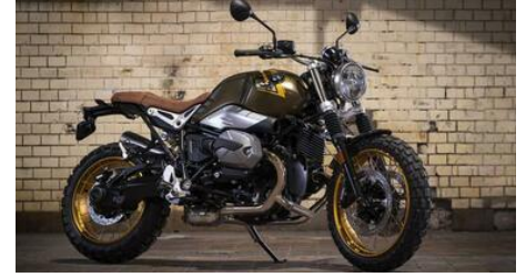
Bmw RnineT, per 2021 si rinnova la famiglia. Novità sulla dotazione ma anche sul motore più potente

CALTAGIRONE EDITORE IL MATTINO CORRIERE ADRIATICO IL GAZZETTINO QUOTIDIANO DI PUGLIA LEGGO PUBBLICITA'