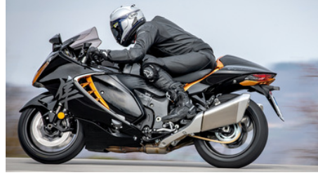
Suzuki Hayabusa, in sella al "falco pellegrino". Velocità autolimitata a 299 km/h, aerodinamica perfetta, frenata superba